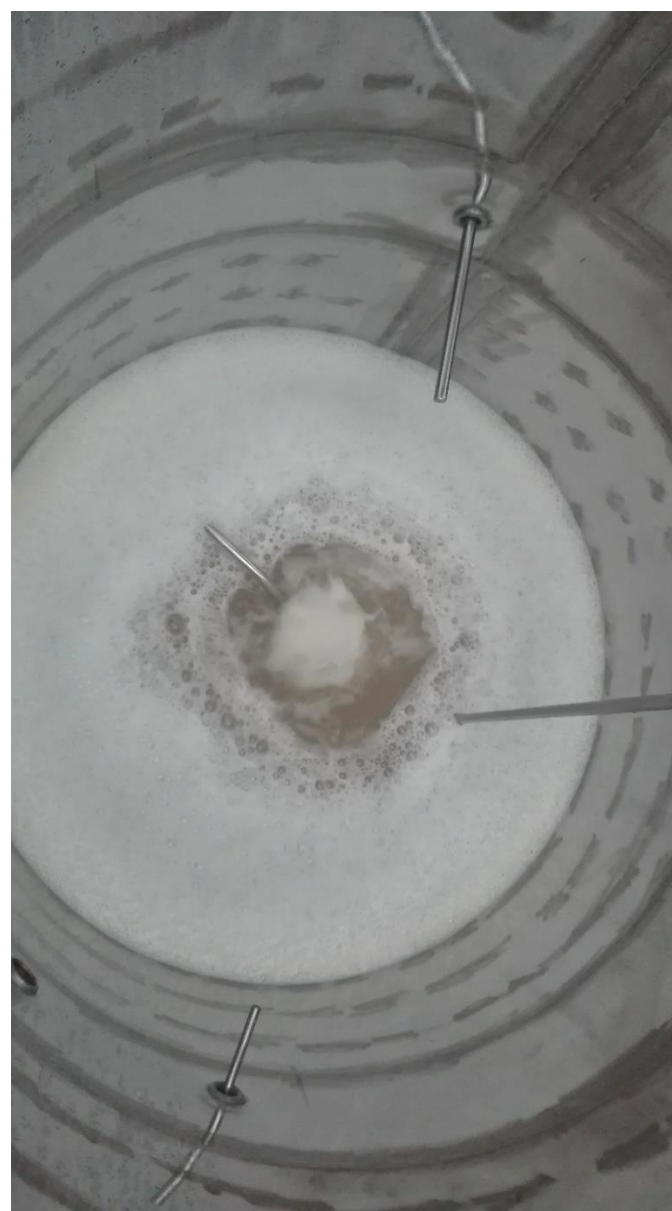
Interno del tino