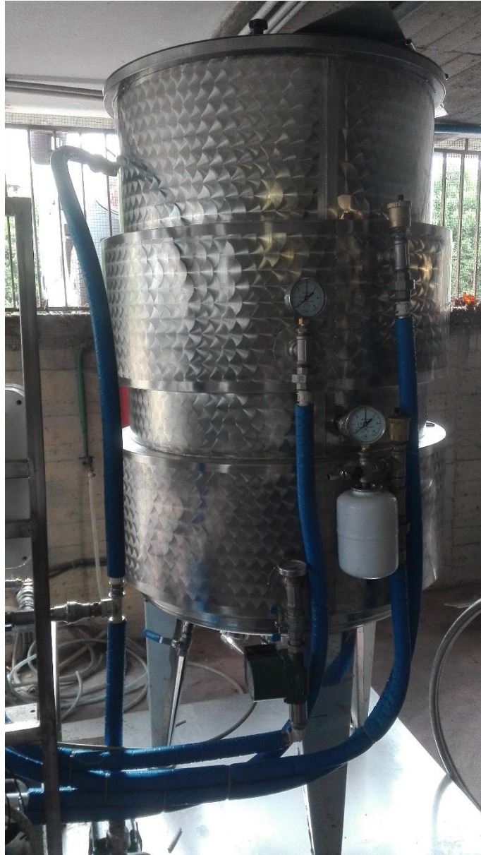
Vasca moltiplicazione lieviti